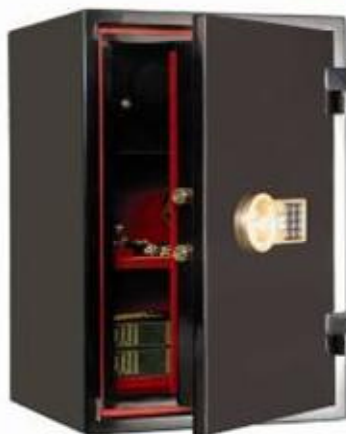
ASK-67T EL GOLD