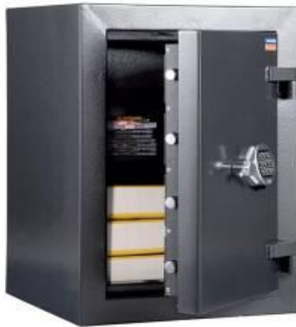
Bastion 67 EL