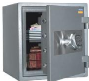
Гарант EBPO-46 EL

Цены указаны в гривнах в учётом НДС. # - поставляются под заказ.