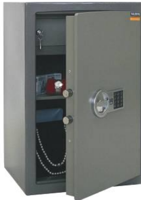
ASK-67 T EL